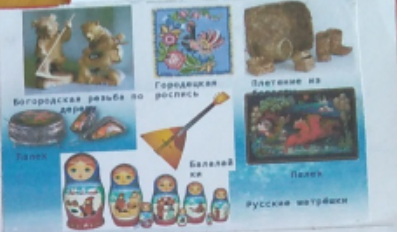
Богородская резьба по дереву